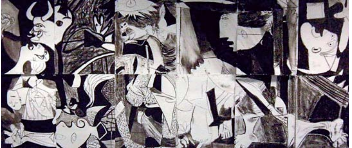
ผลงานวาดเส้นของปีกาลโซ ชื่อ ศักยภาพประกอบของภาพเกอร์นิกา วาดด้วยดินสอดำบนกระดาษขาว

เรื่อง: พศ.พิเชษฐ สุภรโชติ มหาวิทยาลัยราชภัฏสวนดุสิต