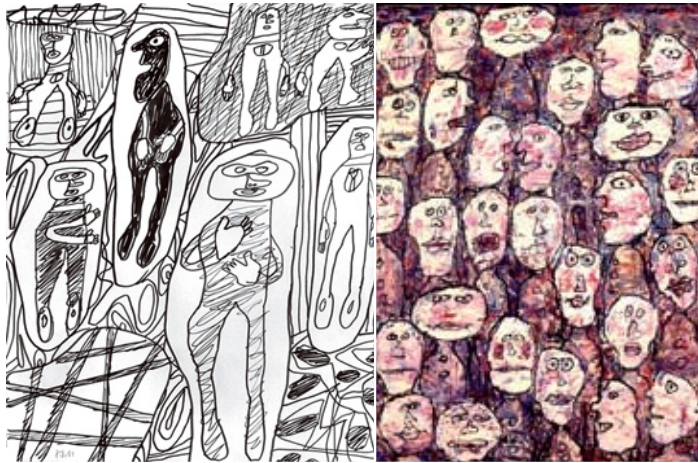
(ซ้าย) ผลงานของของ ดูปูมเฟต์ ชื่อ Suite With 7 Characters 1981 วาดเส้นด้วยหมึกดำบนกระดาษ (ขวา) ผลงานจิตรกรรมของ ของ ดูปูมเฟต์ ชื่อ Affluence ที่ใช้การวาดเส้นเป็นส่วนประกอบในงานจิตรกรรม (ล่าง) ผลงานชื่อ The New York Times ของราเชนเบิร์ก ที่ใช้วิธีการถ่ายโอนภาพ (Transfer Drawing)