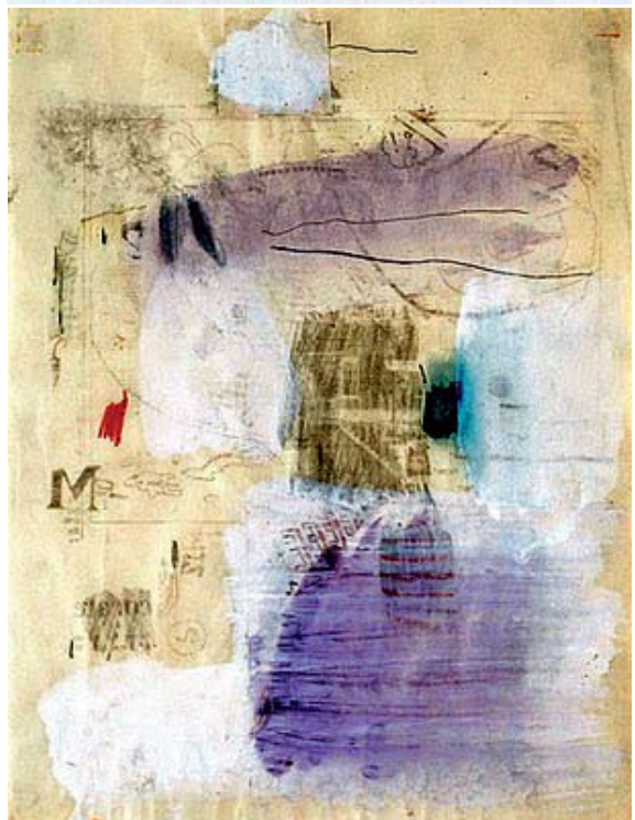
(บน) ผลงานวาดเส้นของปิกาสโซ ชื่อ เกอร์บิโก เทคนิคผสมวาดด้วยดินสอดำ สีพาสติก และกรวยองบนกระดาษขาว (ล่าง) ผลงานของเราเช่นเบิร์กที่ใช้วิธีการถ่ายโอนภาพ (Transfer Drawing) เทคนิคผสมกับการวาดเส้น สีพาสติก สีน้ำ และการปะติด