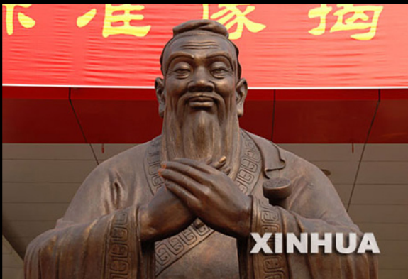
รูปปั้นขงจื้อที่มูลนิธิขงจื้อจัดสร้างขึ้น

-เมื่อประตูบานหนึ่งปิด อีกบานหนึ่งก็เปิดแต่บ่อยครั้งที่เรามัวแต่จ้องประตูบานที่ปิดจนไม่ทันเห็นว่ามีอีกบานที่เปิดอยู่