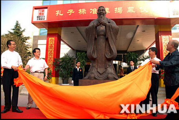
เปิดตัวรูปปั้นขงจื้อมาตรฐาน