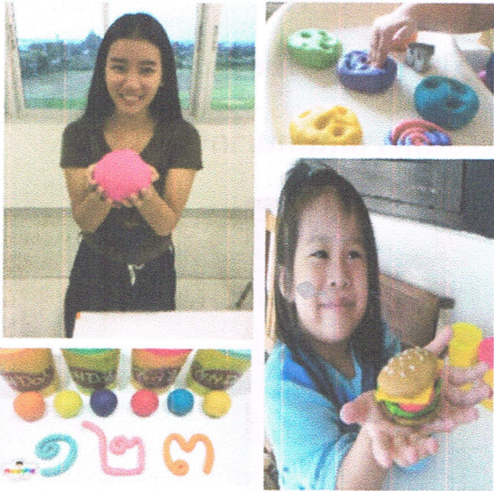
Play Doh มาสนุก